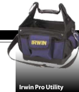
Irwin Pro Utility

Bahco er på banen med en hel serie af nye værktøjskasser i polypropylen. Med bl.a. udtræksbakker og nonslip-håndtag. Kan låses med hængelås. 500 kr.