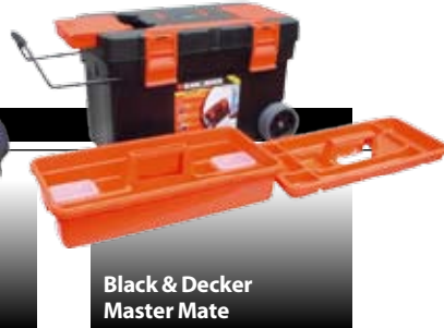
Black & Decker Master Mate

Her er masser af kapacitet til værktøj og tilbehør. Bunden er lavet af sej, slidbestandig plast, og tasken har forstærkede nitter overalt. 498 kr.